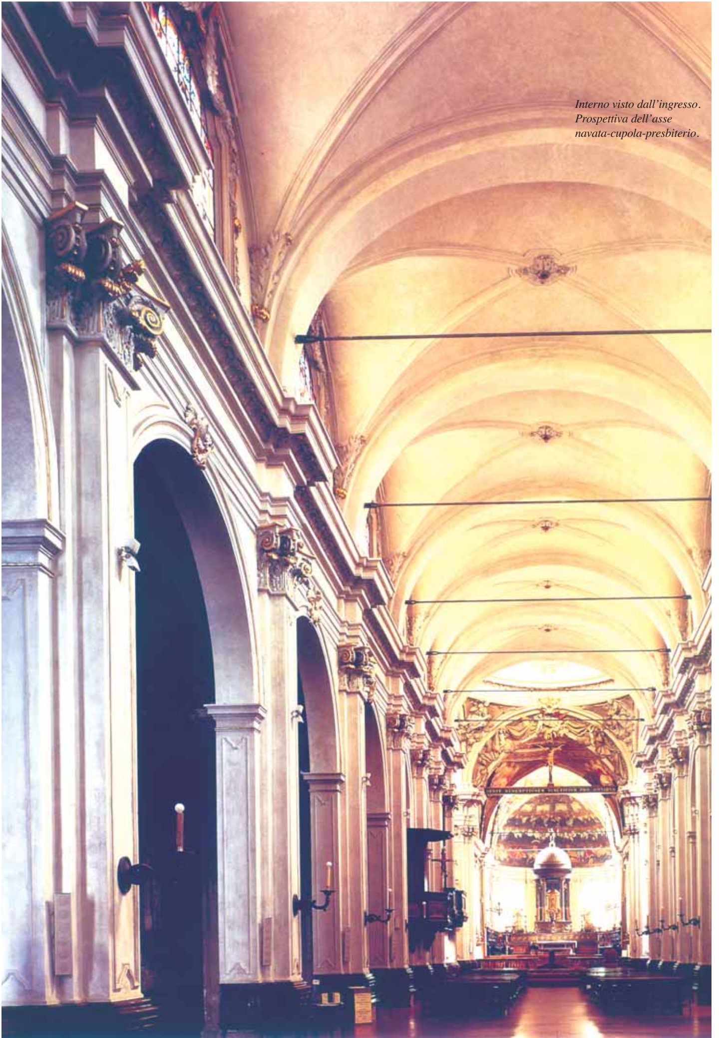
Interno visto dall'ingresso. Prospettiva dell'asse navata-cupola-presbiterio.