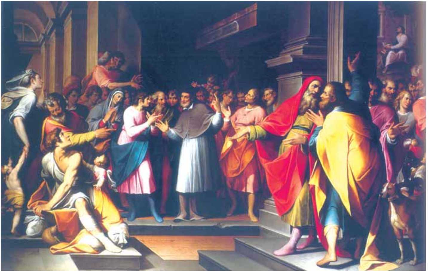
Camillo Procaccini, Disputa fra Ambrogio e Agostino e conversione di Agostino: Prima campata del presbiterio.