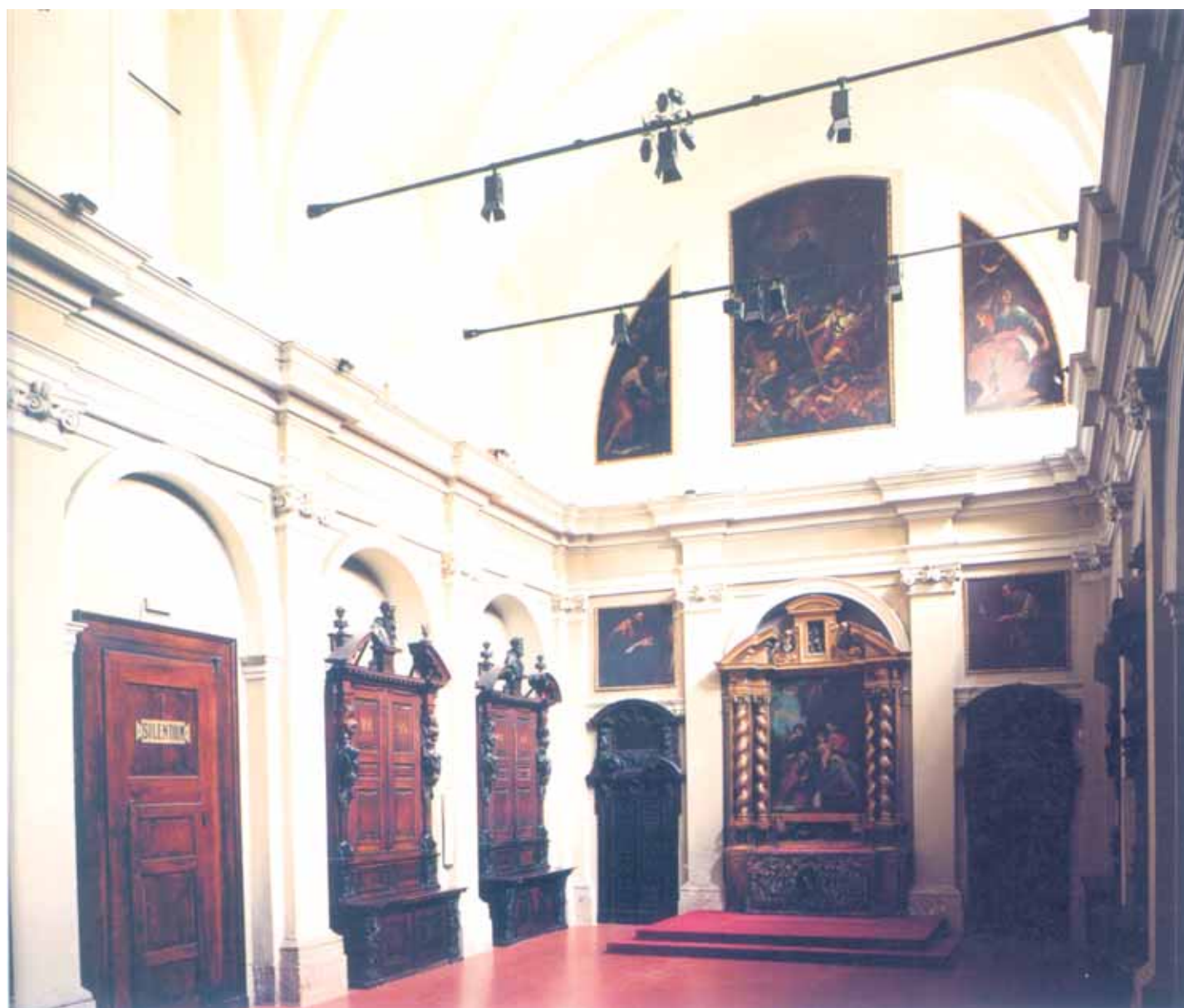
Sacrestia, visione d'insieme