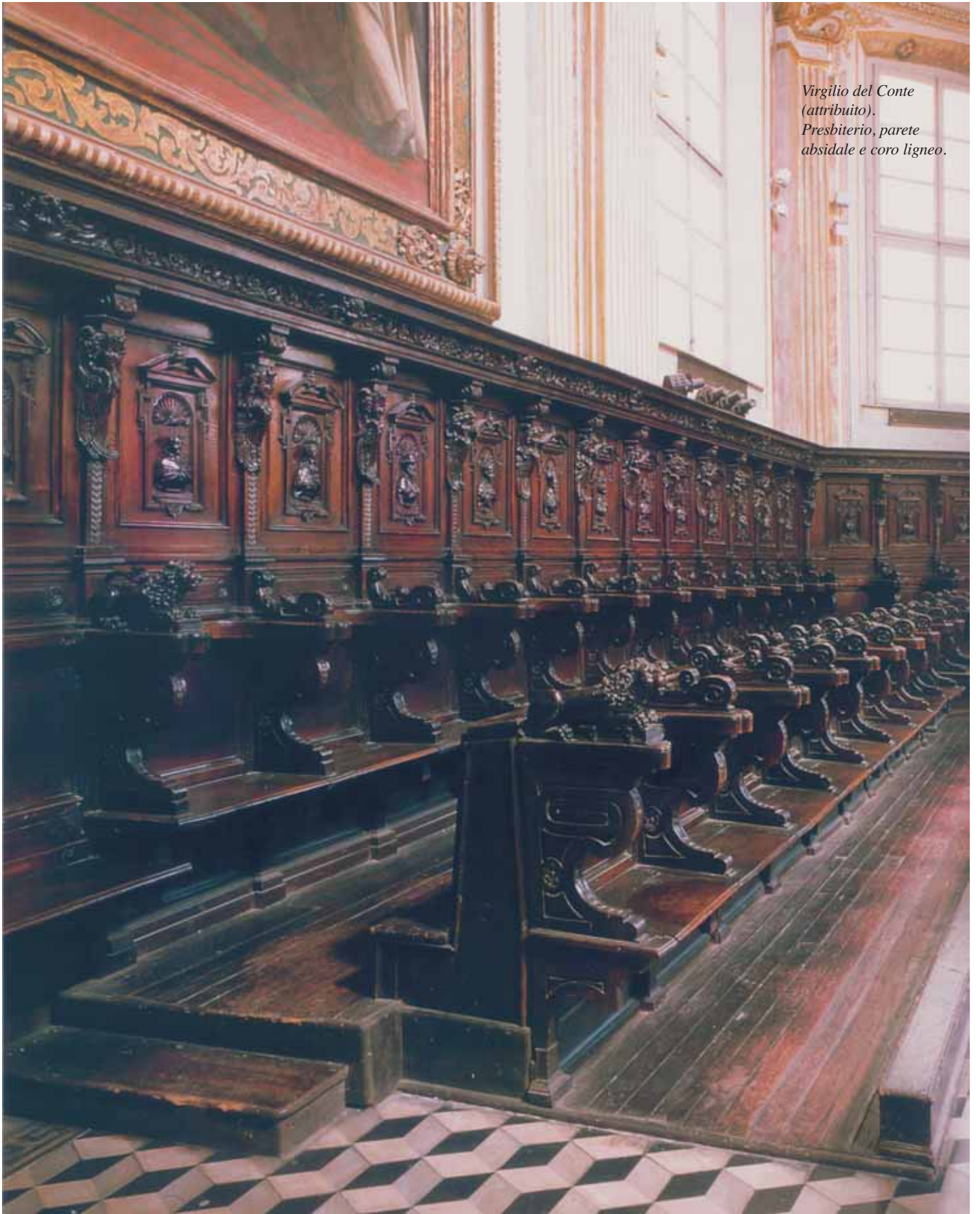
Virgilio del Conte (attribuito). Presbiterio, parete absidale e coro ligneo.