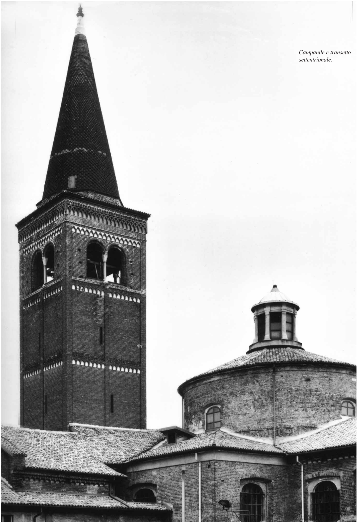
Campanile e transetto settentrionale.